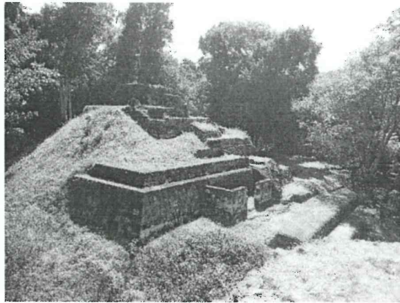
Foto 4. Edificio 6, Grupo Maler