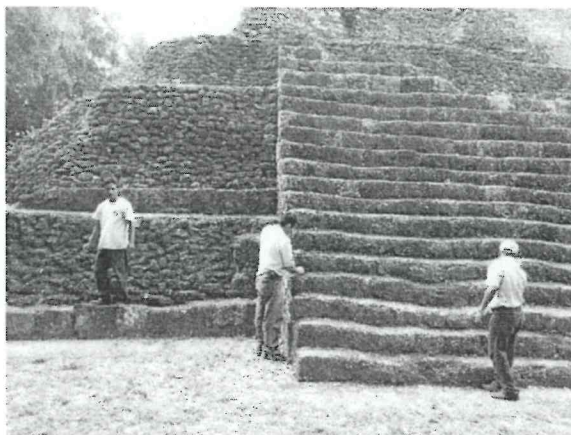
Foto 8. Edificio 152, Plaza C