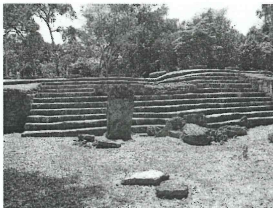
Foto 9. Edificio 90, Plaza B