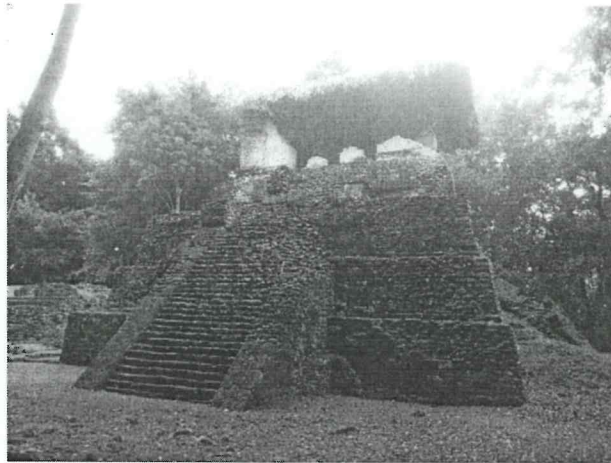
Foto 2. Edificio C, Topoxte