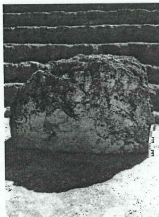
Foto 1. Estela 41, Acrópolis Este