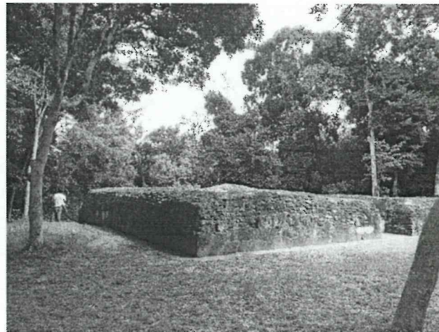
Foto 5. Edificio 260, Plaza A