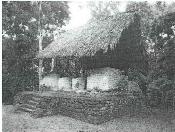
Foto 3. Edificio G, Topoxte