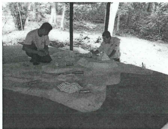
Foto 7. La limpieza de la maqueta es un trabajo sumamente minucioso por los cuidados que debe tenerse