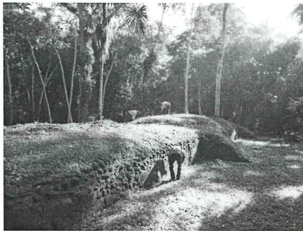
Foto 6. Edificio 261, Plaza A